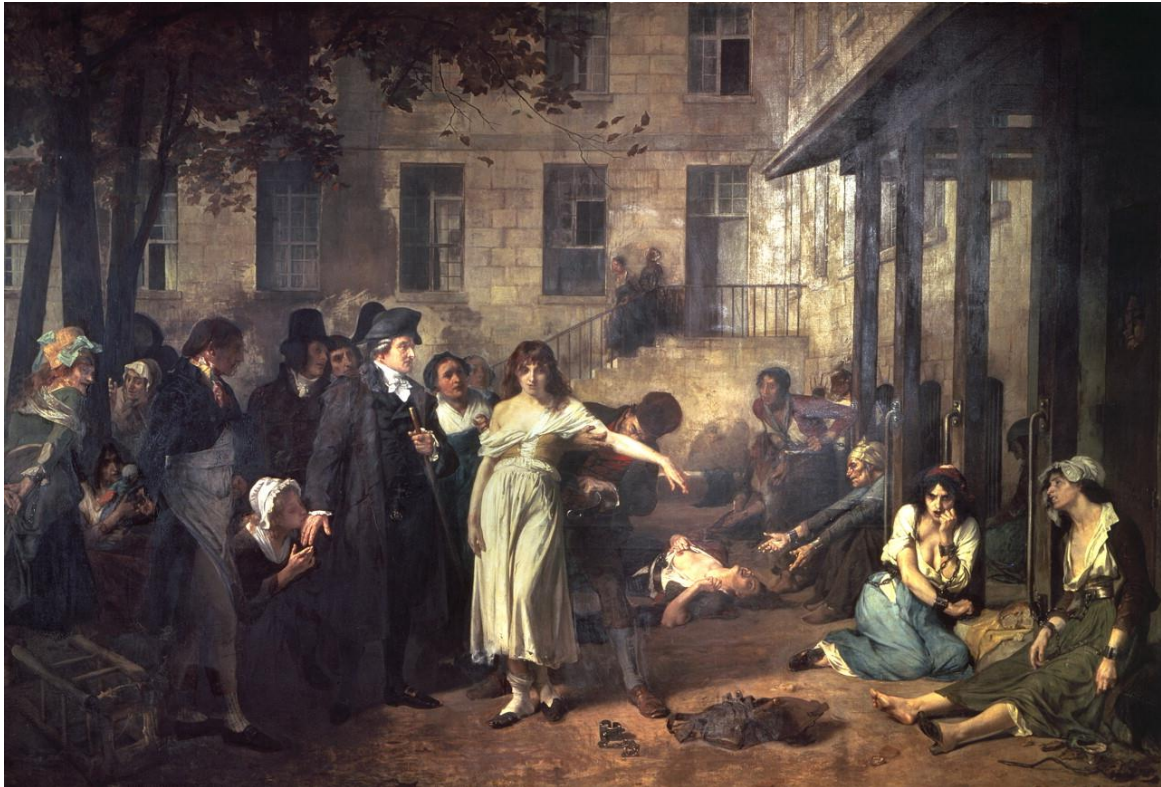
Tony Robert-Fleury: Philippe Pinel Orders Removal of the Chains of the Mad at the Salpêtrière