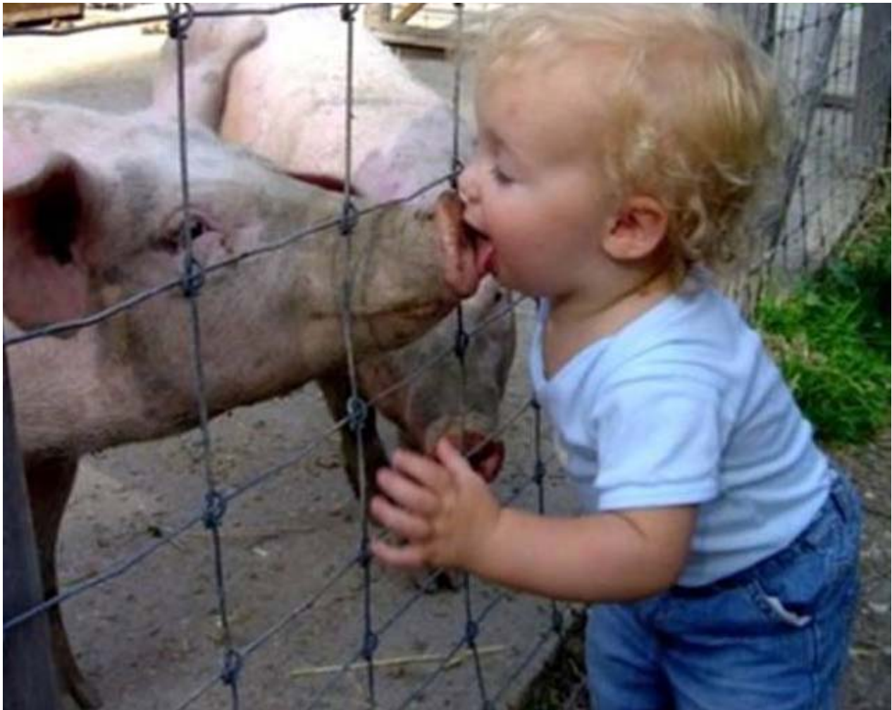
Een "onschuldige" varkenskus

Het lijkt zo absurd om het te hebben over een werelddictatuur en het is ook bijna niet te geloven, maar ja, dat was in de tweede wereldoorlog