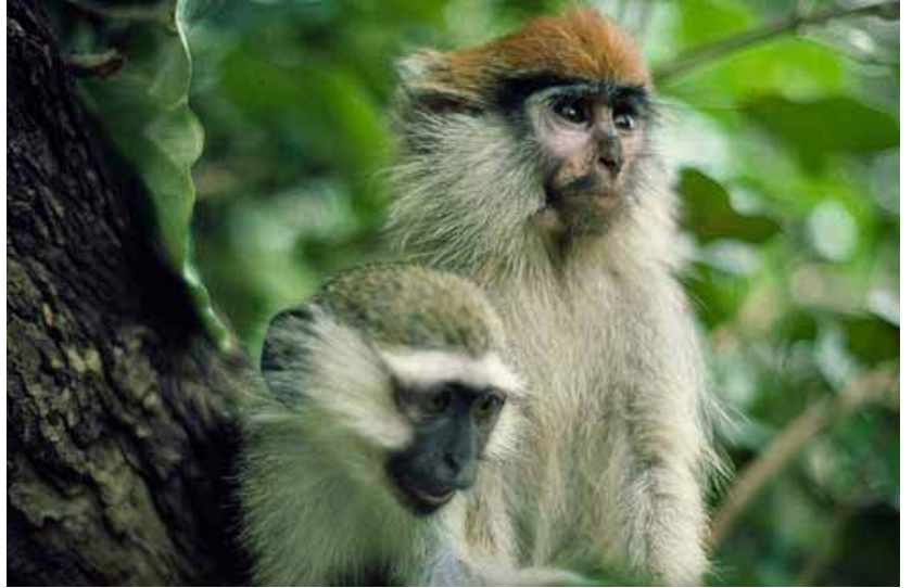
De voor vaccins gebruikte groene aapjes