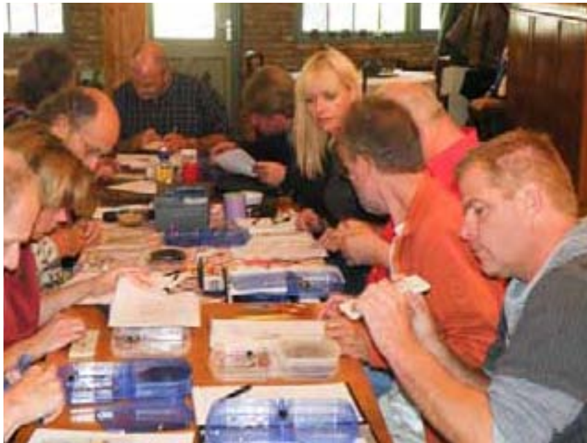
Samen aan het werk tijdens een zappermaakcursus

Wat het varkensgriepvaccin betreft? Wat ik tot nu toe weet (en de inentingscampagne begint volgende week pas!) is: 25 mensen overleden na de vaccinatie in Amerika, 5 in Zweden en een verhaal van een verder gezonde Duitse zakenman die tot een testgroep behoorde, maar bloed begon te spugen na de inenting. Het kan zijn dat de andere overleden personen, zoals gezegd wordt, tot een risicogroep behoorden, maar zijn dat niet juist de mensen die ze het eerst willen inenten en gaat het dan niet om moord met voorkennis als men doorgaat met inenten? In ieder geval is het een keuze die ik niet graag zou maken en ik zou er alles behalve verantwoordelijk voor willen zijn.